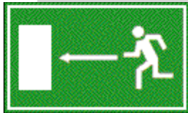
Fluchtweg nach links

Flucht- und Rettungswege zur Rettung von Personen sind fester Bestandteil der heutigen Brand- und Bausicherheit. Rettungswege müssen vorhanden sein. Jedes Gebäude mit Aufenthaltsräumen muss in jedem Geschoss über mindestens zwei voneinander unabhängigen Rettungswegen verfügen. Ein Rettungsweg muss über eine Treppe führen, der zweite kann mit Leitern der örtlichen Feuerwehr sichergestellt werden. Hinweisschilder zeigen im Brandfall den kürzesten Weg aus dem Gefahrengebiet. Diese Beschilderung ist im ganzen Bundesgebiet gleich.