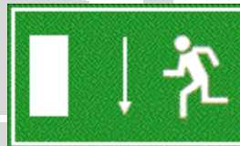
Fluchtweg nach unten