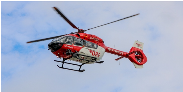
AIRBUS Helicopters H145 (Quelle: DRF Luftrettung) Homepage: www.drf-luftrettung.de

In unserer 9. Ausgabe möchten wir Euch ein weiteres, sehr wichtiges Rettungsmittel in unserer Region vorstellen - „Christoph 42“, mit Stationierung in Schachtholm bei Rendsburg.