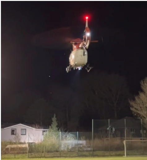
23.02.2023 - Abflug von „Christoph 42“

Technische Hilfe - „Flugsicherheit“ Absicherung Landung Rettungshubschrauber Sportplatz Langwedel