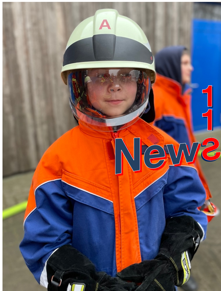
29. März 2023: Dienst Jugendfeuerwehr „Schaumübungsanlage“