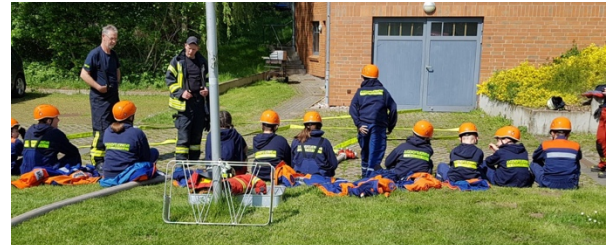
17.05.2023 - 24-Stunden Dienst der Jugendfeuerwehr Langwedel

Am 17. Mai fand unser jährlicher 24 - Stunden - Dienst statt. Dieses Mal standen viele Einsätze auf dem Programm. Es gab von Personensuche nachts im Wald, über Ölspur auf der Straße abstreuen, bis hin zu Person aus verqualmten Gebäude retten viele schöne Einsätze.