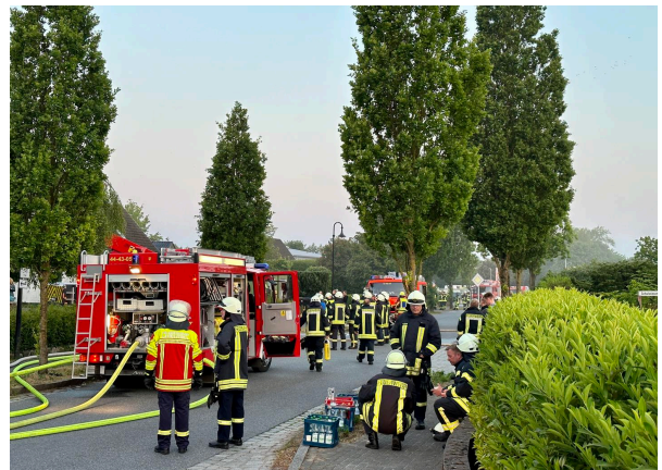
Mit uns im Einsatz die Wehren aus Dätgen, Nortorf, Borgdorf-Seedorf und Schülp bei Nortorf.

Um 03:56 Uhr erfolgte an diesem Morgen die Alarmierung über die Sirenen und unsere digitalen Melder. Das Einsatzstichwort „FEU G - Dätgen“ und die bis nach Langwedel zu sehende, schwarze Rauchwolke verhiessen uns nichts Gutes. Vor Ort brannte ein Einfamilienhaus.