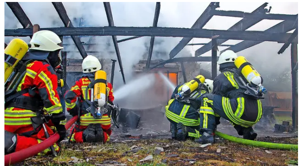
06.06.2023 - Brandbekämpfung eines Hausbrandes in Dätgen

Um 03:56 Uhr erfolgte an diesem Morgen die Alarmierung über die Sirenen und unsere digitalen Melder. Das Einsatzstichwort „FEU G - Dätgen“ und die bis nach Langwedel zu sehende, schwarze Rauchwolke verhiessen uns nichts Gutes. Vor Ort brannte ein Einfamilienhaus.