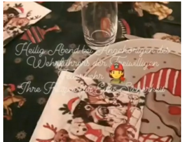
„Heilig Abend bei Angehörigen des Wehrlöhrens der Freiwilligen Feuerwehr - Ihre Freizeit für Eure Sicherheit“

Während es in den meisten Häusern immer mehr anfang nach leckerem Weihnachtsessen zu riechen, kämpften unsere Feuerwehrleute um das Leben eines Menschen, sicherten die Unfallstelle ab, sorgten dafür, dass Unbeteiligte nicht mit diesen Bildern konfrontiert wurden und räumten die Unfallstelle im Nachgang.