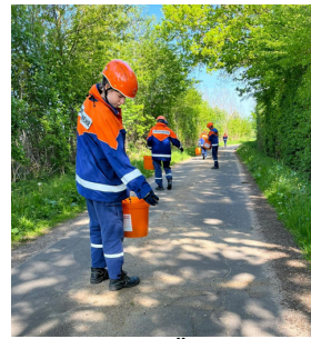
Abstreuen einer Ölspur

Am 17. Mai fand unser jährlicher 24 - Stunden - Dienst statt. Dieses Mal standen viele Einsätze auf dem Programm. Es gab von Personensuche nachts im Wald, über Ölspur auf der Straße abstreuen, bis hin zu Person aus verqualmten Gebäude retten viele schöne Einsätze.