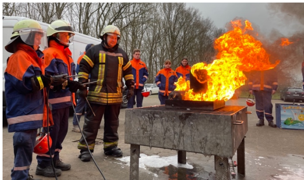
29.03.2023 - Übungsdienst „Schaummittelanlage“

Haben wir DEIN Interesse geweckt? Dann melde Dich bei UNS!