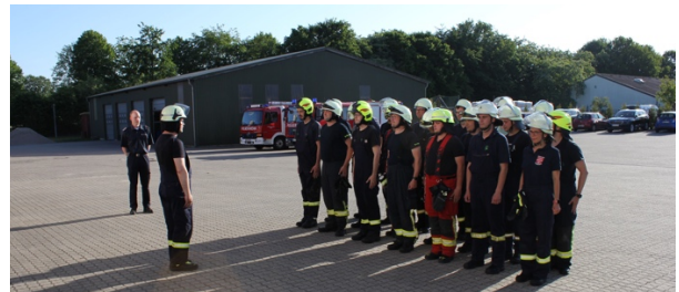
Antreten zur Abschlussprüfung des Truppführerlehrgangs

Am 08. Juni fand die Abschlussprüfung des Truppführerlehrgangs des Amtes Nortorfer-Land auf dem Gelände der Freiwilligen Feuerwehr Nortorf statt.