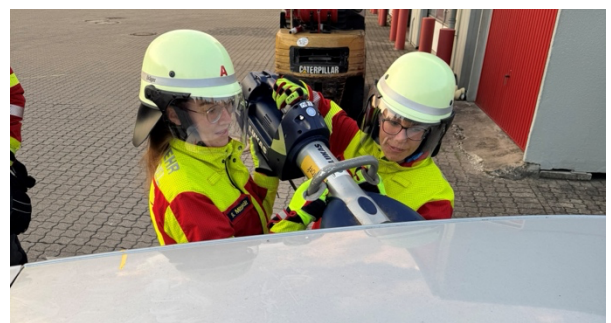
Einsatz von schwerem Rettungsgerät an einem PKW

Um die Ausbildung der Kameradinnen und Kameraden auch an realen Objekten - in dem Fall ein Pkw - üben zu können, haben wir uns bei der FF Nortorf getroffen. Hier hatten wir die Gelegenheit, die einzelnen Schritte zur Rettung einer Person aus einem verunfallten Pkw ohne Zeitdruck zu üben.