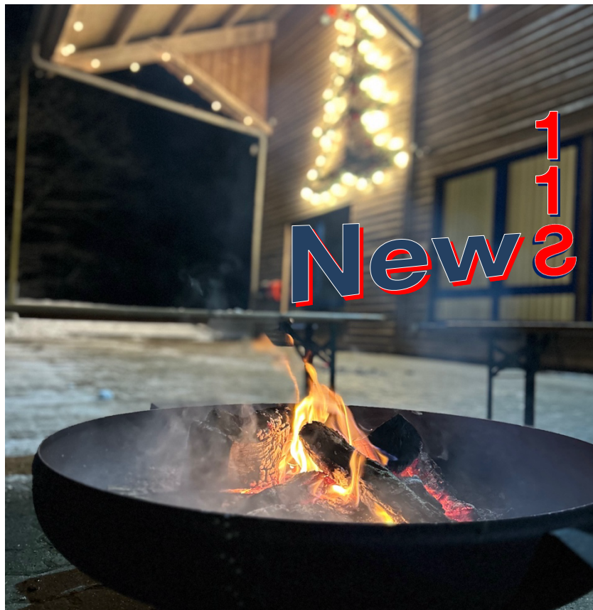
Adventslichterfest der Freiwilligen Feuerwehr Langwedel