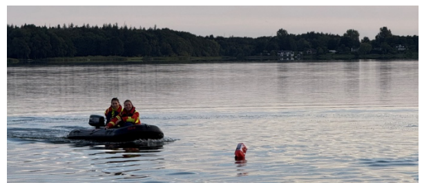
Orientierungs- und Bewegungsfahrt auf dem Brahmsee

Hier haben wir unser Rettungsboot ILSE im Brahmsee zu Wasser gelassen und die Handgriffe zur Steuerung des Bootes geübt. Parallel wurde Erste Hilfe mit Wasserbezug geübt, sowie eine Löschwasserversorgung aufgebaut.