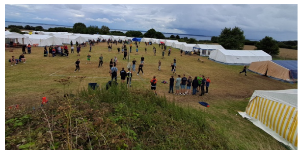
Ein Blick auf das Gelände des JF-Zeltlagers in Klein Waabs

Am Anreisetag waren alle etwas aufgeregt, zumal einige von uns daran zum ersten Mal teilnahmen. Am Abend fand ein großes Antreten aller Wehren statt. Es war sehr warm an dem Tag, weshalb leider viele umgekippt sind. Wir haben uns die Zelte mit der Jugendfeuerwehr Nortorf geteilt. Natürlich gab es auch viele Aktivitäten: An einem Tag gab es Fußball und Swingolf, was sehr lustig war. An zwei Tagen fand der Wettbewerb „Schlag die Jugendfeuerwehr“ statt. Dabei mussten wir gegen andere Jugendfeuerwehren in verschiedenen Spielen antreten und möglichst viele Punkte holen. Außerdem gab es ein Volleyball- und ein Wikingerschachturnier. Die Jüngeren von uns nahmen am Wikingerschachturnier teil, die Älteren am Volleyballturnier. Das Wetter war zwischendurch sehr interessant: Wir hatten Tage, an denen es sehr warm war, und leider gab es auch einen Tag, an dem es nur geregnet hat und wir nicht wirklich etwas machen konnten. Trotz allem war das Zeltlager sehr toll und wir freuen uns, nächstes Jahr wieder dabei zu sein.