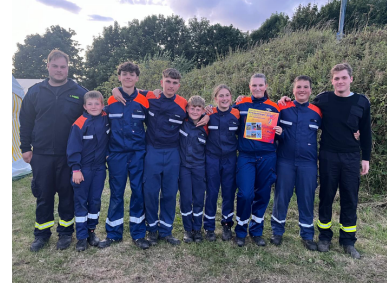
Teilnehmer der JF Langwedel am Zeltlager

Vom 27. Juli bis 02. August 2025, nahmen wir mit 10 Jugendlichen und 5 Ausbildern der Jugendfeuerwehr am Kreiszeltlager in Klein Waabs teil.